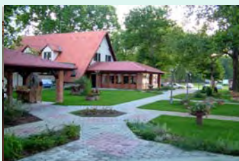
Hotel Dunav 3 *, Ilok