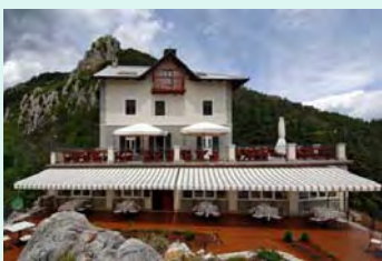
Hotel Draga di Lovrana 4 *