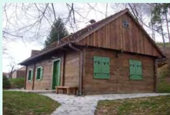
Vuglec breg (pansion komfor), Krapinske toplice