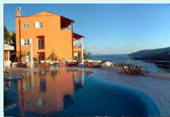
Villa Annete 4 *, Rabac