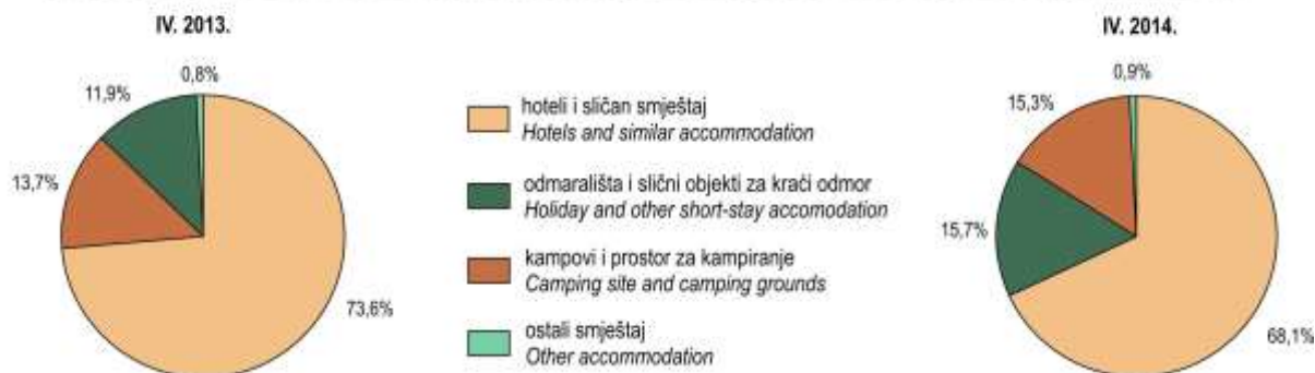
G-2. STRUKTURA NOĆENJA STRANIH TURISTA PREMA NKD-u 2007., ODJELJAK 55 U TRAVNJU 2013. I TRAVNJU 2014. STRUCTURE OF FOREIGN TOURIST NIGHTS, ACCORDING TO DIVISION 55 OF NKD 2007, APRIL 2013 AND APRIL 2014