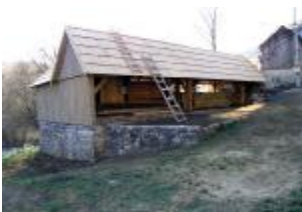
Pilana na vodeni pogon, Plitvička jezera