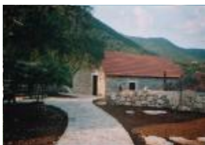
Etno-selo Kokočići, Vrgorački kraj