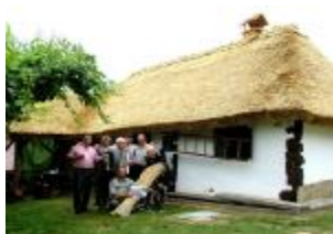
Tradicijnska međimurska hiža, Sv. Martin na Muri