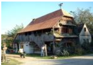
Tradicijnska posavska kuća, Lonjsko polje