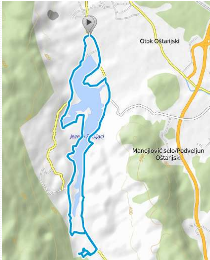
Lokalna ruta Sabljaci