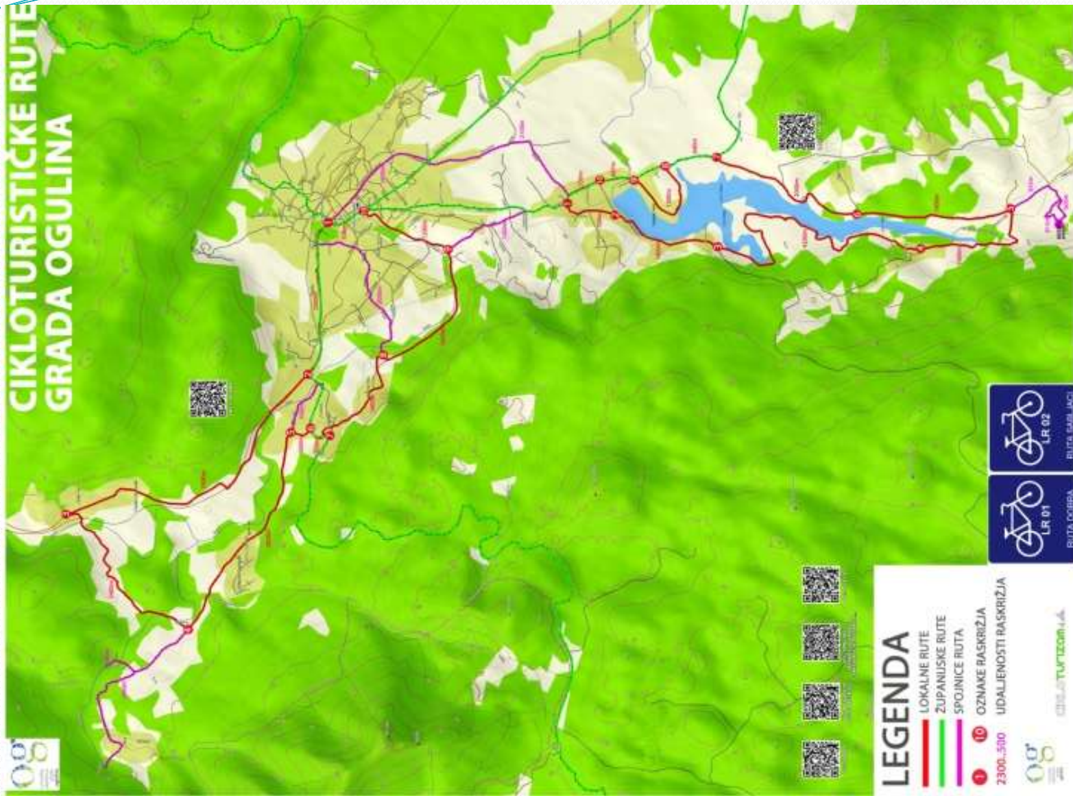
Cikloturistička karta grada Ogulina