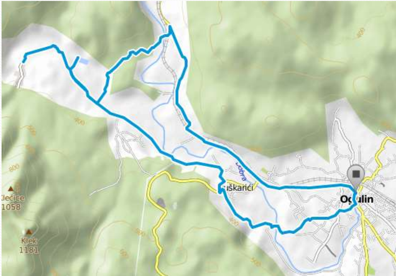
Lokalna ruta Dobra