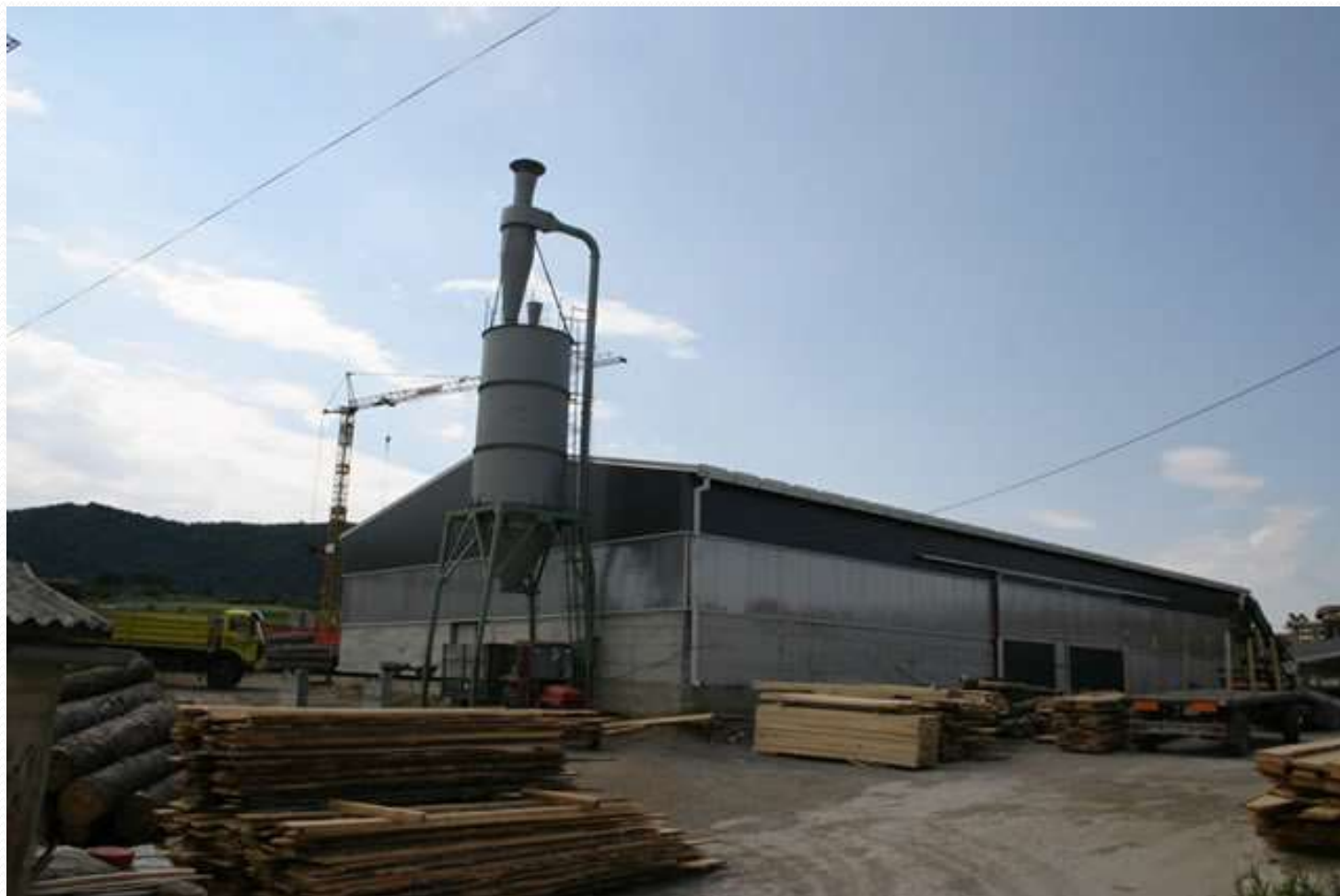
Odlazak po drvenu građu