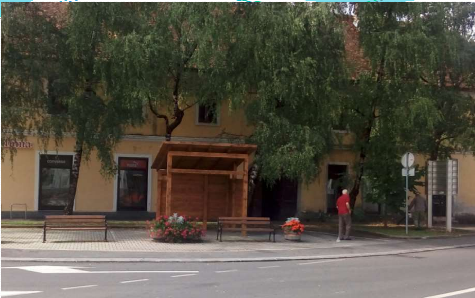
Bajk punkt na lokaciji