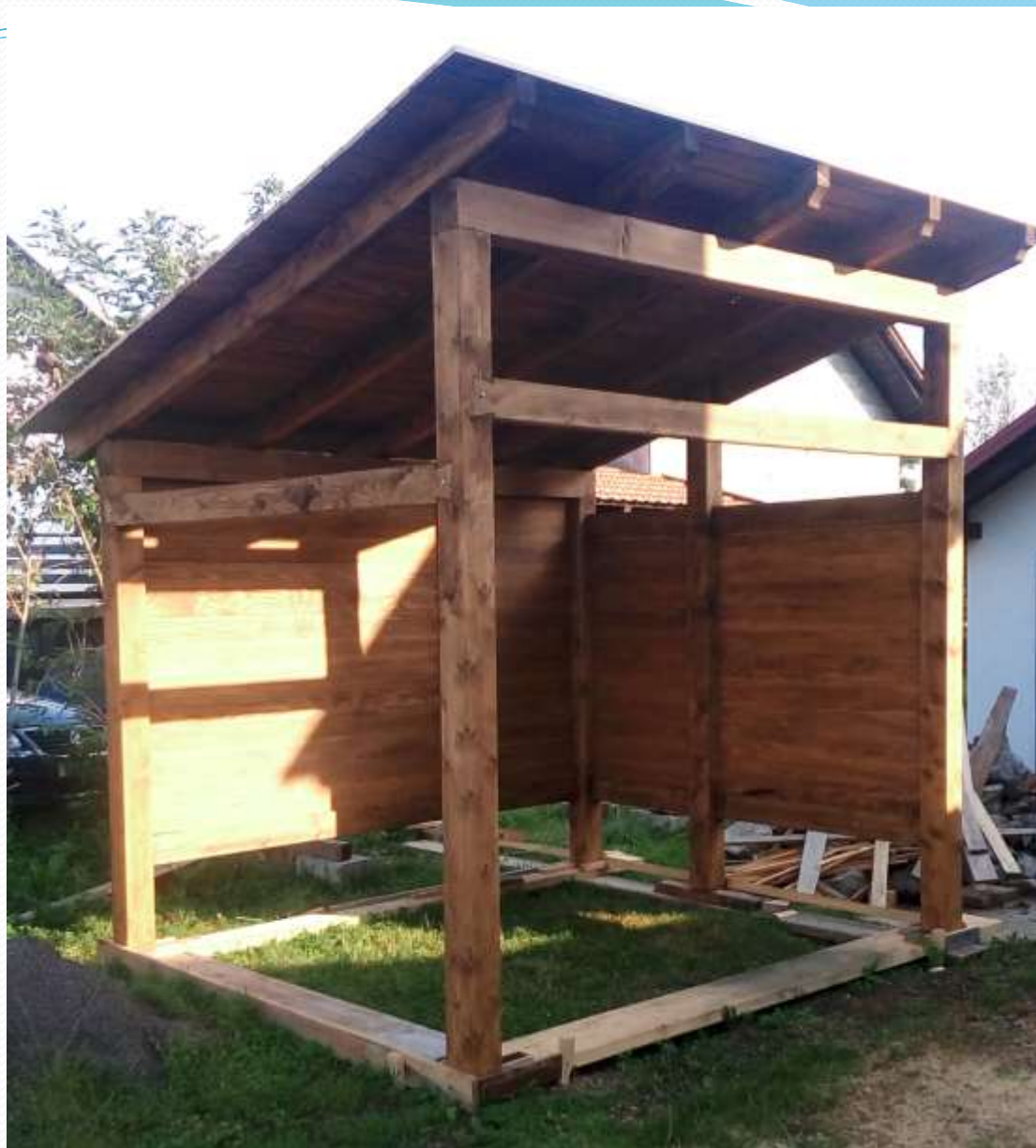
Bajk punkt u gradnji