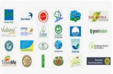
Towards Carbon-Neutral Tourism Eco Certification for Tourism Accommodation