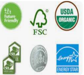
Inhabit IS IT GREEN?: Eco-Labels and Certif...