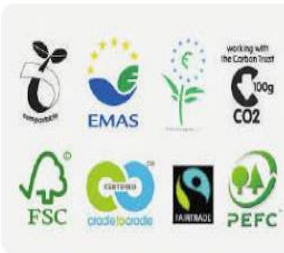
Eco-labelling and Eco-friendly Products Eco Label and Trade