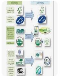
Commission for Environ... Environmental Labels I...