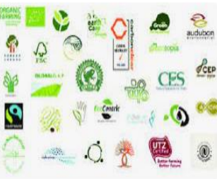
ResearchGate 1 Examples of Eco-labels: 435 Standards ...