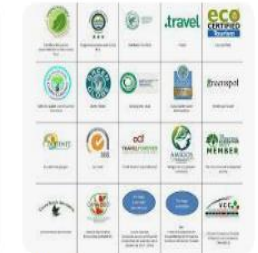
University of Idaho Defining and Implementing a ...