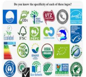
Hal Irae A Review of Eco-labels and their E...