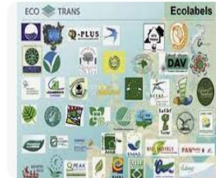
DestiNet.eu Initiative The