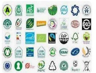
MEZOGHI GROUP clothing eco label, Exclusive Deals and Of...