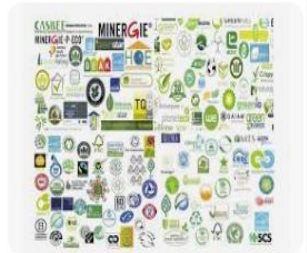
Eco-labelling and Eco-friendly Products Eco Label and Trade