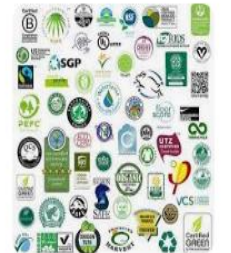
Pinterest Here are some Eco labels...