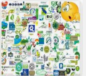
Alex 5 reasons why the travel industry i...