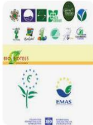
ResearchGate Eco-symbols and eco-c...