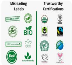
THRIVE blog Eco-friendly Labels: What's Really I...