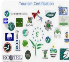
www.biodiversity.ru Sustainable Tourism - Tools - Certific...