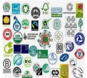
TravelMole Find your way through the forest of...