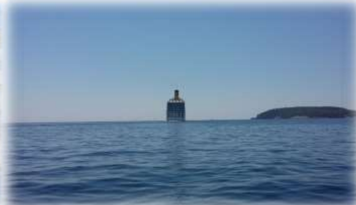
Promet putnika s brodova na kružnim putovanjima: