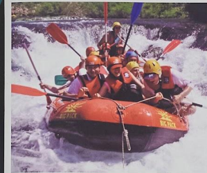
Active and adventure hotels

Association of family and small hotels of Croatia, www.omh.hr , info@omh.hr