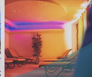
Health and wellness hotels