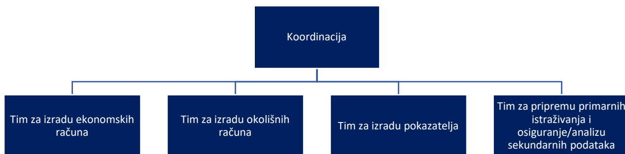
Slika 2. Organizacijska struktura projekta izrada i uspostava Sustava satelitskih računa održivog/održivosti turizma Republike Hrvatske

Sukladno odredbama Priloga 1 Sporazuma o partnerstvu u provedbi aktivnosti u okviru reforme predviđene Nacionalnim planom oporavka i otpornosti , Ministarstvo turizma i sporta pokrenulo je aktivnosti za uspostavljanje tima za međuinstitucionalnu suradnju Ministarstva turizma i sporta s ostalim institucijama RH koje generiraju podatke relevantne za izradu Sustava satelitskih računa održivog/održivosti turizma Republike Hrvatske .