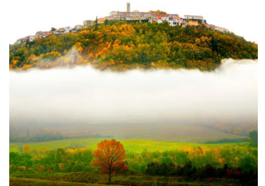
Autor: Nikola Šolić