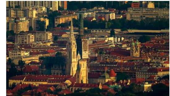
Autor: Nikola Šolić