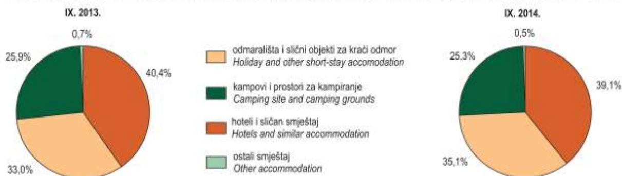
G-2. STRUKTURA NOĆENJA STRANIH TURISTA PREMA NKD-u 2007., ODJELJAK 55 U RUJNU 2013. I RUJNU 2014. STRUCTURE OF FOREIGN TOURIST NIGHTS, ACCORDING TO DIVISION 55 OF NKD 2007, SEPTEMBER 2013 AND SEPTEMBER 2014