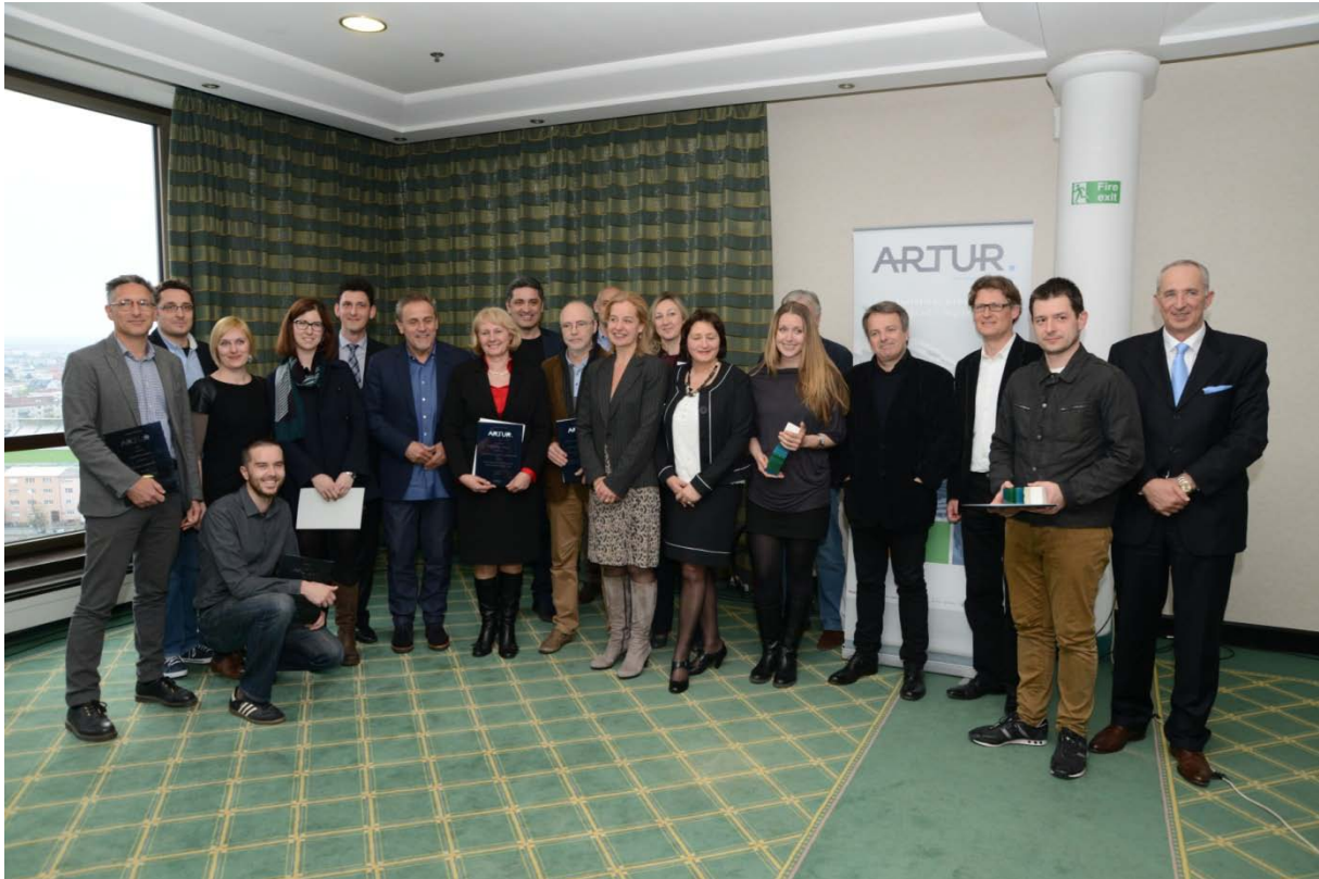
Zajednička fotografija s dobitnicima ARTUR nagrade