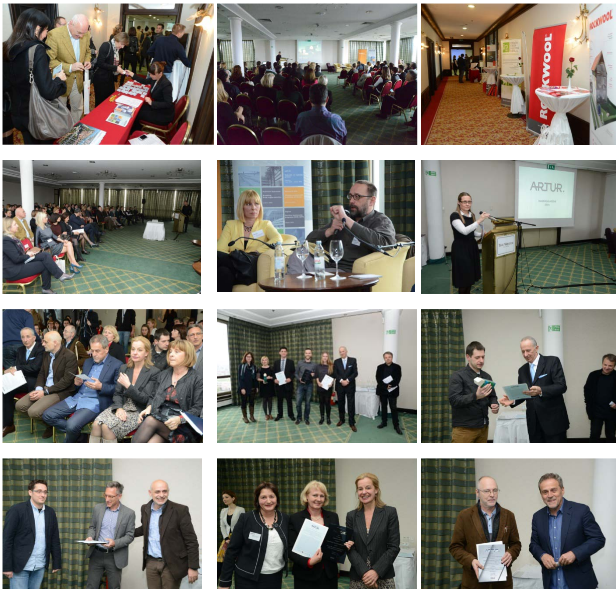
Konferencija ARTUR, 28.03.2014. Hotel Westin