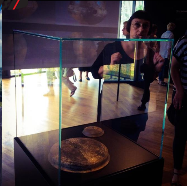
Od ideje do kulturno turističkog proizvoda. Ministarstvo turizma. Zagreb. 18/11/2015