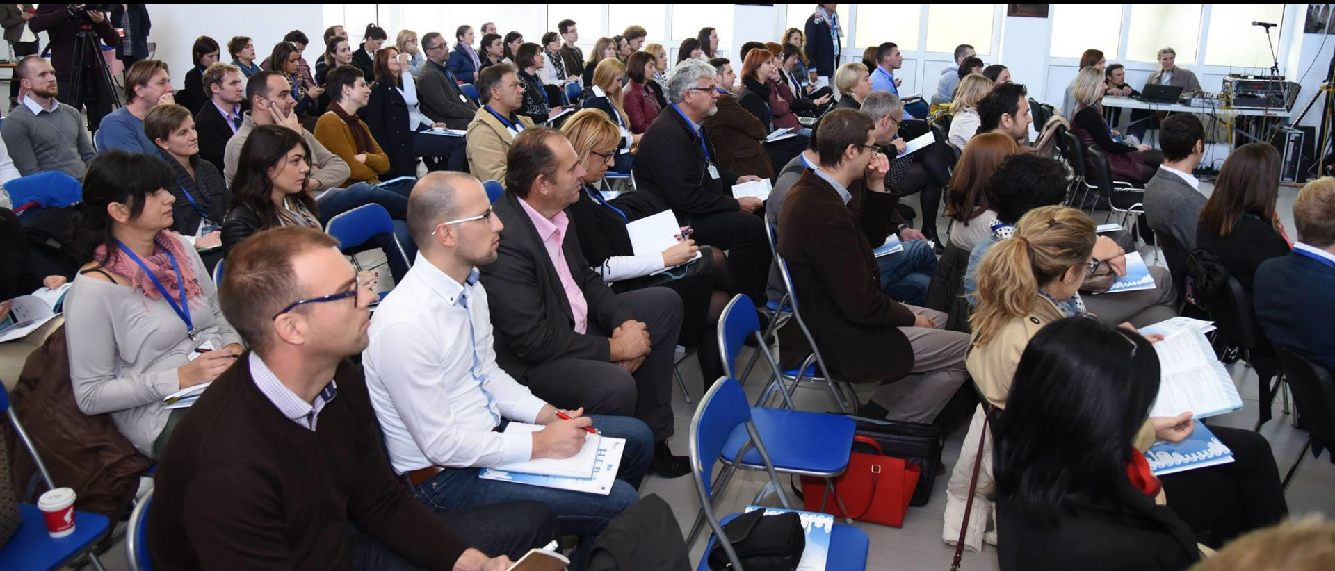
Od ideje do kulturno turističkog proizvoda. Ministarstvo turizma. Zagreb. 18/11/2015