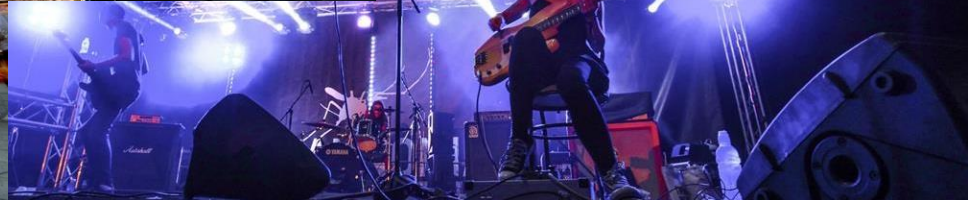
Od ideje do kulturno turističkog proizvoda. Ministarstvo turizma. Zagreb. 18/11/2015