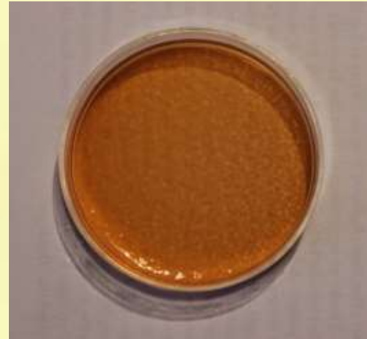
Posudica 2 AGAR: Slanetz-Bartley

*U posudici 2 smo nasadili materijal na kojemu se mogu razviti fekalne bakterije streptokoki.