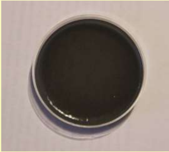
Posudica 1 AGAR: MFC

*U posudici 1 smo nasadili materijal na kojemu se mogu razviti fekalne bakterije koliforme.