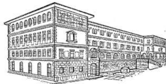
Srednja škola ZVANE ČRNJE ROVINJ Scuola media superiore "Zvane Črnja" Rovigno