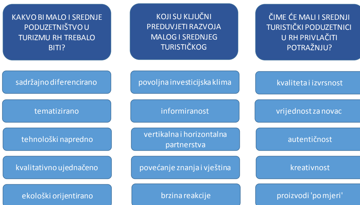
Slika 8.2.1. Temeljne odrednice razvojne vizije obiteljskog smještaja RH

U skladu s gornjim odrednicama, razvojna vizija malog i srednjeg turističkog poduzetništva u RH do 2020. godine glasi: